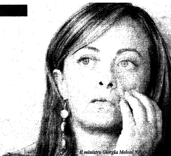
Il ministro Giorgia Meloni

■ Una dote di 5mila euro a disposizione di ogni impresa che riaprirà le porte. Così contiamo di dare un'occupazione stabile, a lungo termine, a 10mila disoccupati con meno di trentacinque anni